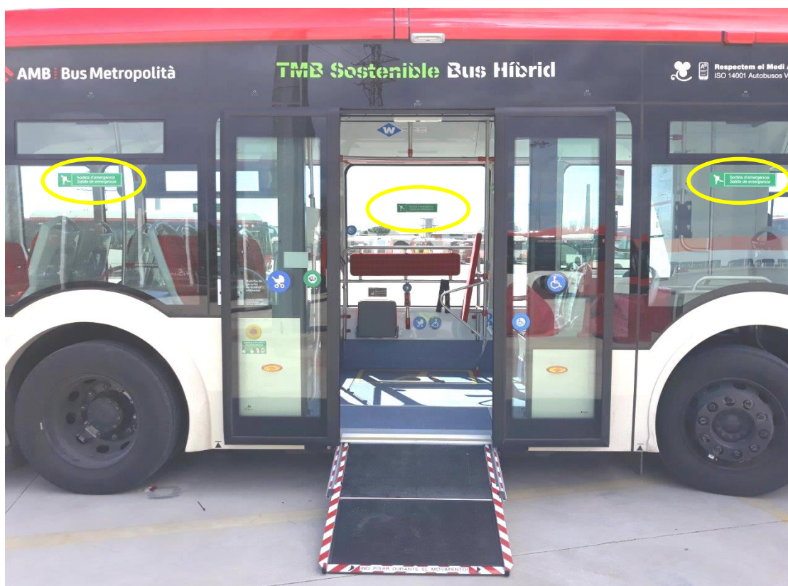
Imagen 1: Salidas emergencia

Estas estarán señalizadas para su fácil localización tanto del exterior como del interior del vehículo según imagen. Se colocarán en las mínimas ventanas necesarias para poder cumplir la normativa según CE 2001/85.